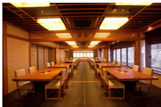
鴨川沿いのお部屋