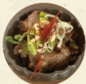
牛すじボン酢 300 円