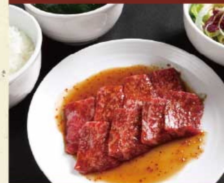
和牛カルビ定食 1,980円