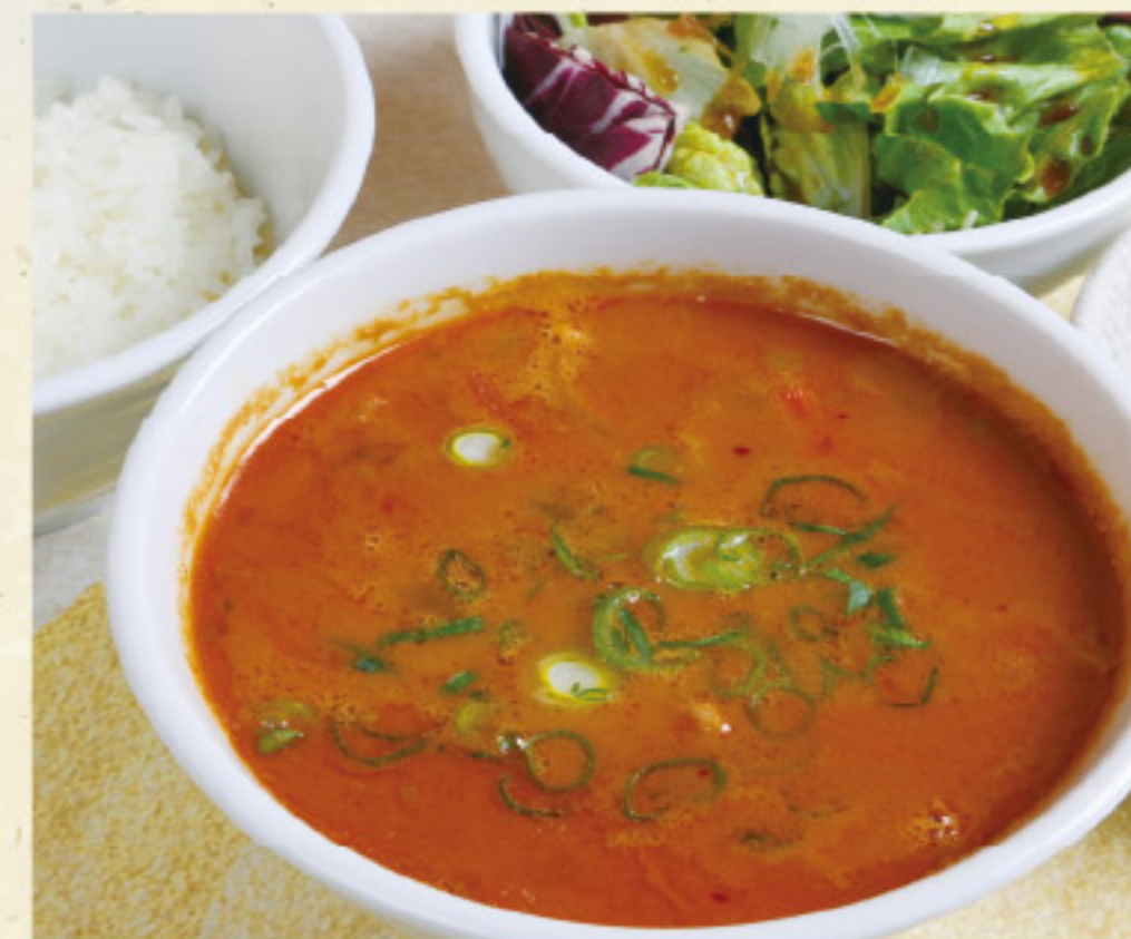
ユッケジャンスープランチ 1,100 円