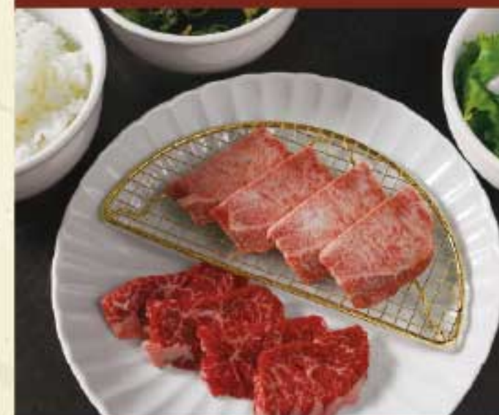
ハラミ&タン塩定食 2,500円