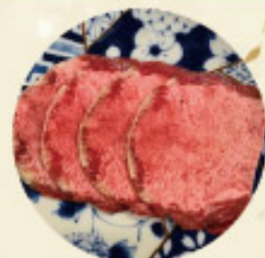
タン塩 900 円