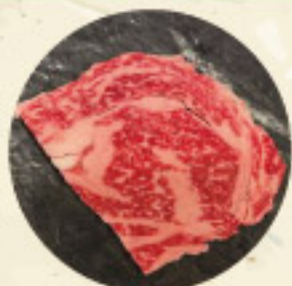
天壇ロース 850 円