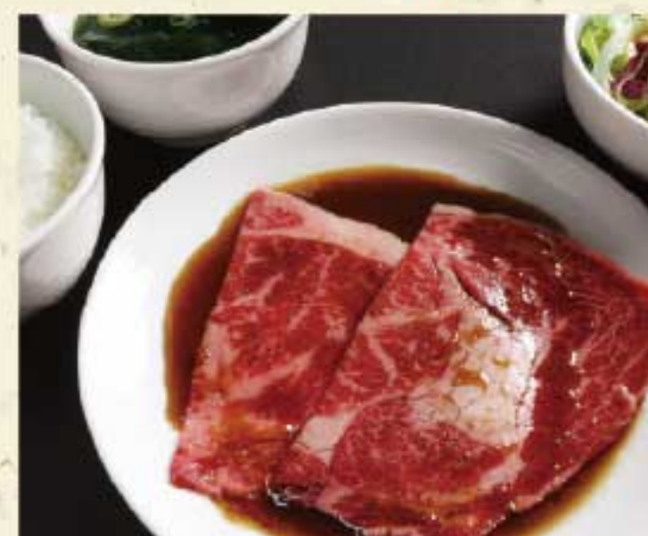
天壇ロース定食 1,650円