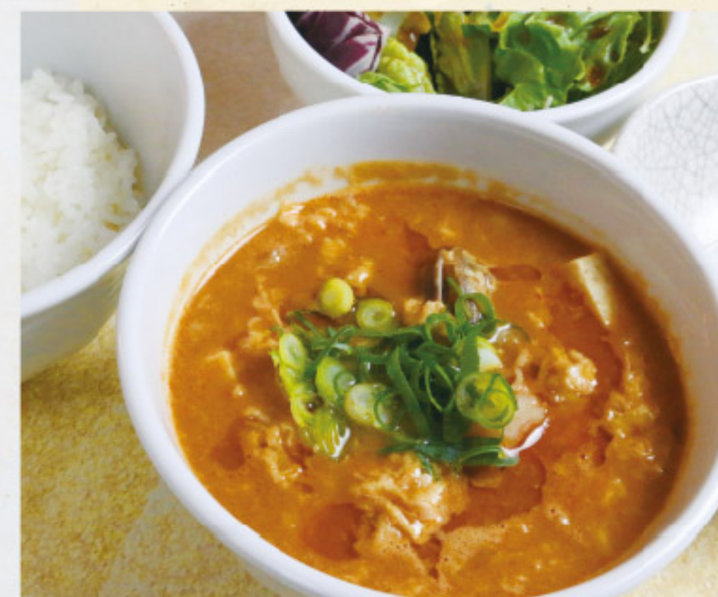
チゲ味噌スープランチ 1,100 円