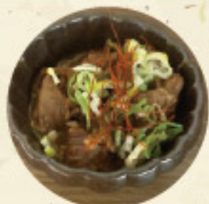
タンチム 300 円