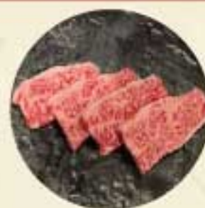
和牛カルビ 1,100 円