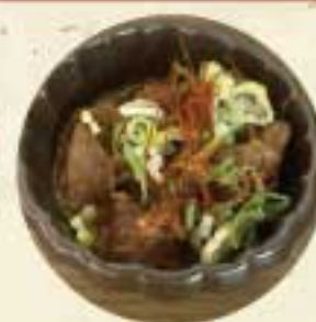
タンチム 300 円