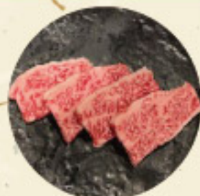
和牛カルビ 1,100 円