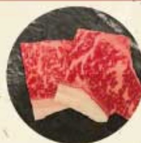
上ロース 850 円