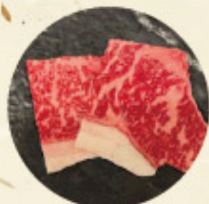
上ロース 850 円