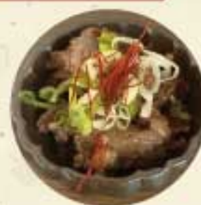
牛すじポン酢 300 円