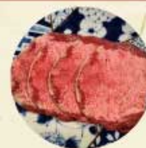
タン塩 900 円