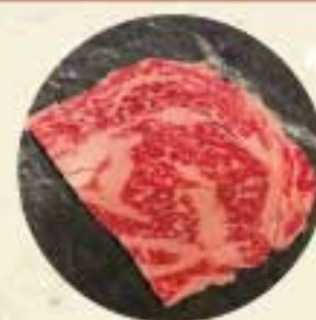
天壇ロース 850 円