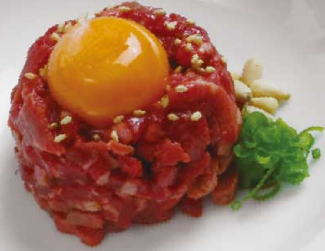
和牛ユッケ 1,800円 厳選されたもも肉を使った至極の一品