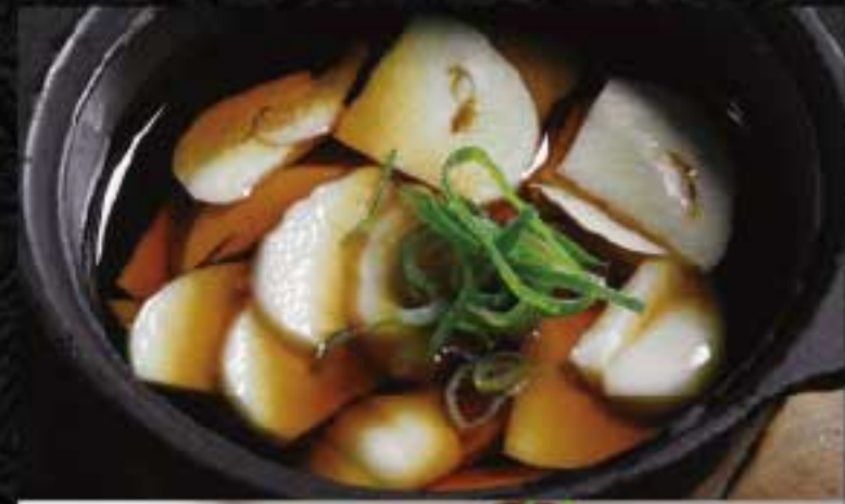
ニンニクオイル焼 600円 網の上で沸騰させてお召し上がりください。 お肉と一緒に野菜に巻くと風味が増します。