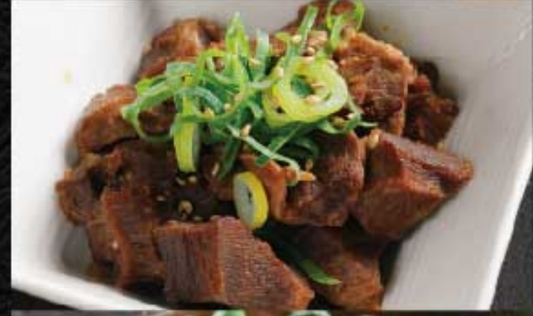
牛タン煮込み 800円 柔らかくコクのある味わいをご賞味ください。