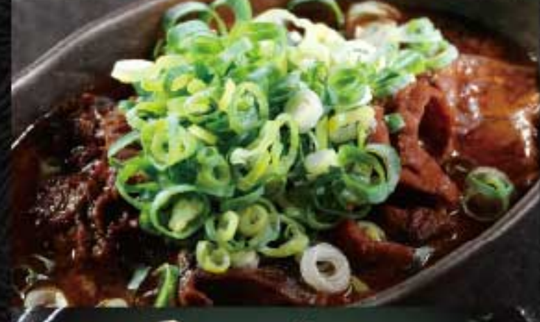
ホルモン煮込み 1,200円 お酒の肴におすすめです。