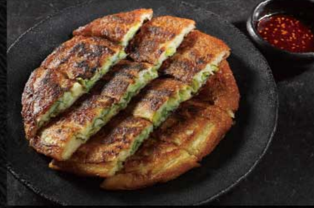
【京の伝統野菜】京都府産 九条ネギのチヂミ 2,400円 京野菜の九条ネギをたっぷり使ったチヂミです。 ハーフサイズ 1,400円