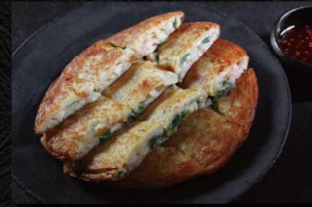
海鮮ネギチヂミ 3,000円 海鮮の旨味を九条ネギと共に閉じこめました。 ハーフサイズ 1,700円