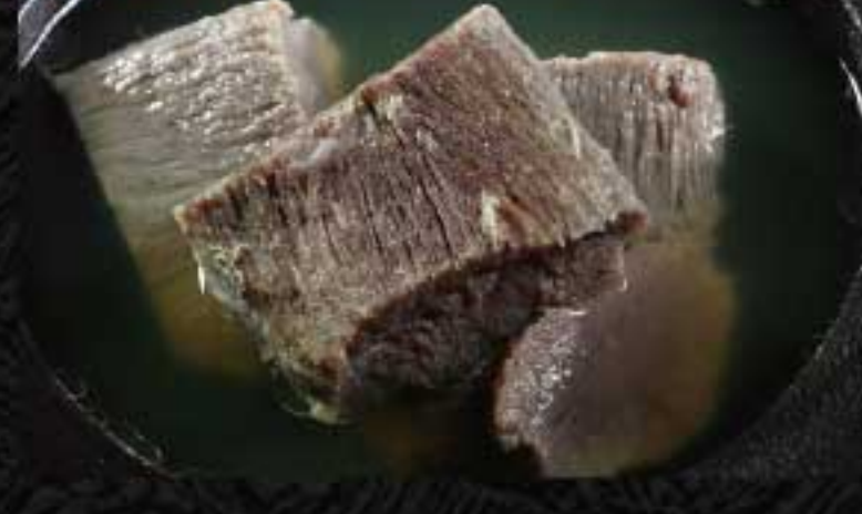
茹でタン 1,600円 ほろほろで柔らかい食感が絶品。