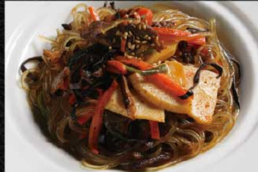
チャプチェ 1,300円 春雨と野菜の炒め物を当店独自の味付けで。